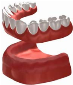
Foto: Traditioneel ondersteunde deelprothese.

Bij de traditionele methode blijft de uitneembare gebitsprothesen zitten door een soort zuigwerking op het mondslimvlies. Het kaakbot slinkt omdat het niet meer wordt belast. Hierdoor verliest de prothese haar houvast. Een slechte of ontbrekende stabiliteit van de prothese is voor veel patiënten een groot esthetisch probleem en kan ook leiden tot pijnlijke plekken op het tandvlees.