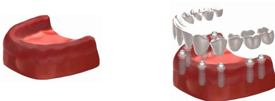
Foto: Vervanging van alle tanden door een op meerdere implantaten verankerde, niet uitneembare brug.

Foto: Vervanging van meerdere tanden door een brug op implantaten.