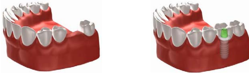
Foto: Vervanging van één enkele tand door een kroon op een implantaat.

Implantaten als tandvervanging voor één of meer tanden: