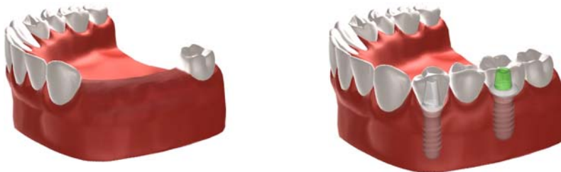
Foto: Vervanging van meerdere tanden door een brug op implantaten.

Foto: Vervanging van één enkele tand door een kroon op een implantaat.